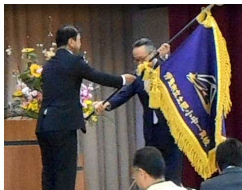
開校式「校旗の伝達」