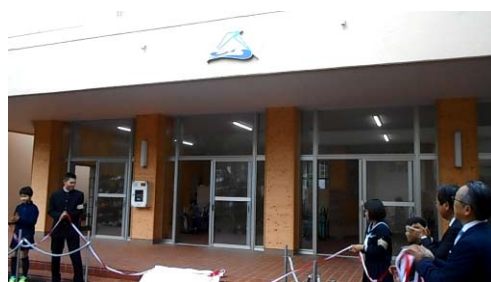
開校式「校章の除幕」

土肥小中一貫校は、これからまだまだ試練の連続だと思います。いろいろな高さの壁を乗り越えていくこととなります。子どもたちのために全職員一丸となって取り組んで参りますが、地域の皆様や保護者の皆様のお力もぜひお貸してください。土肥の皆さんで、小中一貫校をぜひ可愛がってください。どうぞよろしく願いいたします。