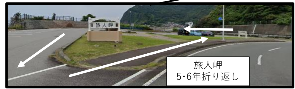
旅人岬 5・6年折り返し