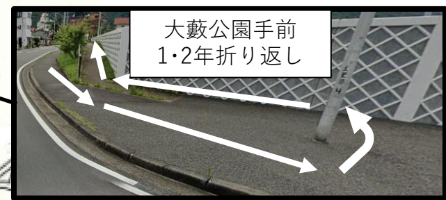
大藪公園手前 1・2年折り返し

全学年、松原公園スタート・ゴール 1・2年生…10時50分後発スタート 大藪公園手前折り返し 約1100m 3・4年生…10時50分先発スタート 旅人岬標識折り返し 約1600m 5・6年生…10時05分スタート 旅人岬折り返し 約2100m 7・8・9年生…男子10時、女子10時10分スタート 男子 小土肥方面一周 約4km 女子 小土肥入口折り返し 約3km