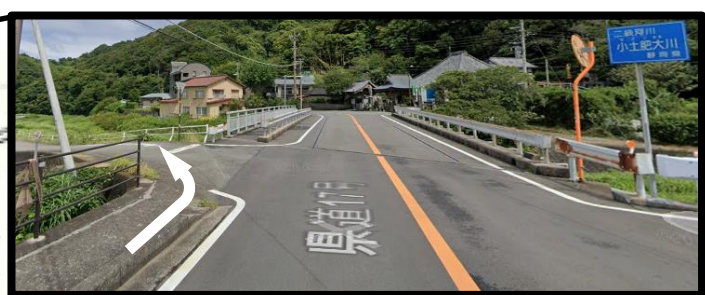
小土肥一周 7・8・9年男子