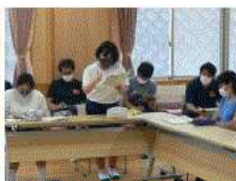
体育の部 種目説明会