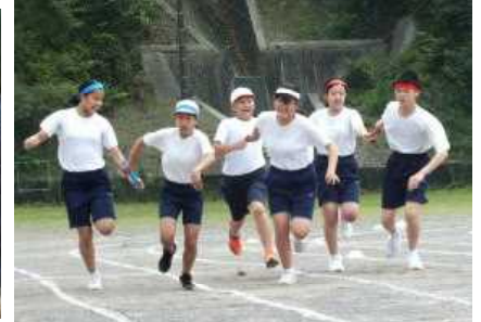
17日(金) 縦割リレー会